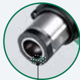
マグネット付 鉄釘を保持できます。